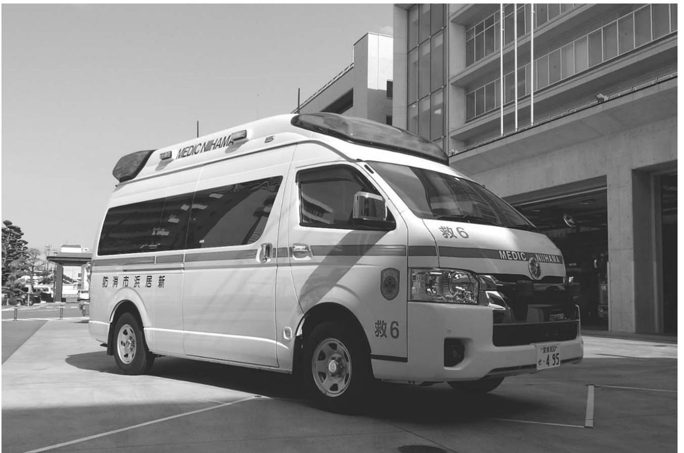
高規格救急自動車