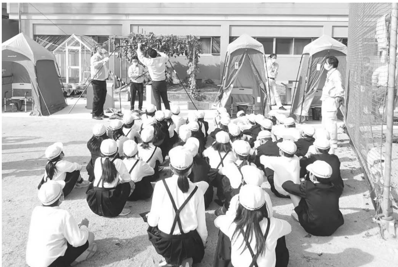
災害時におけるマンホールトイレ設置体験