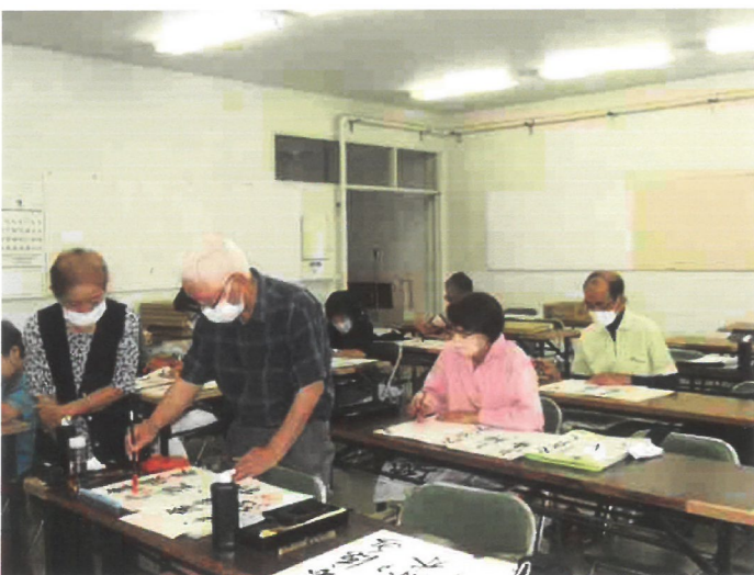
先生のアドバイスを受ける書峰の皆さん