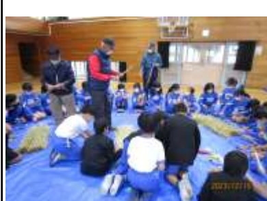
12月19日神郷老人クラブさんの指導で5年生児童のしめ縄作り教室が開催されました

12月14日恒例の三世代交流餅つき大会が開催されました 神郷幼稚園児さんの元気な掛け声 ヨイショ、ヨイショ