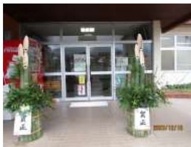
今年もまちづくり委員会の皆さんお手製の立派な門松が公民館玄関に飾られています