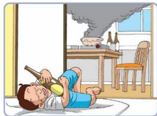
台所と寝室で感知 住警報器が作動