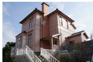
外観写真

あわせて、モリスの没後スコットランドの工業都市グラスゴーで生まれたアーツ・アンド・クラフツの新しい潮流の影響を受けて設計された日暮別邸と建築家・野口孫市(1869-1915)の足跡に着目した連携展示を行います。