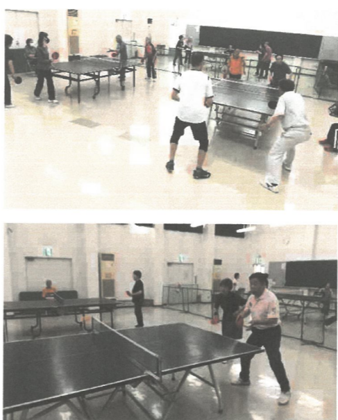
桃山Aの練習試合の様子

80才までと一応の目標を立ててはいますが、健康であればいつまでも続けたいと思っています。よろしくお祈りします。