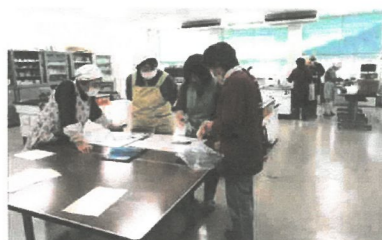
活動中のクロワッサンの皆さん