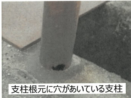
支柱根元に穴があいている支柱