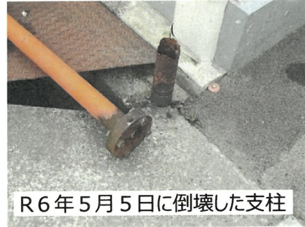
R6年5月5日に倒壊した支柱