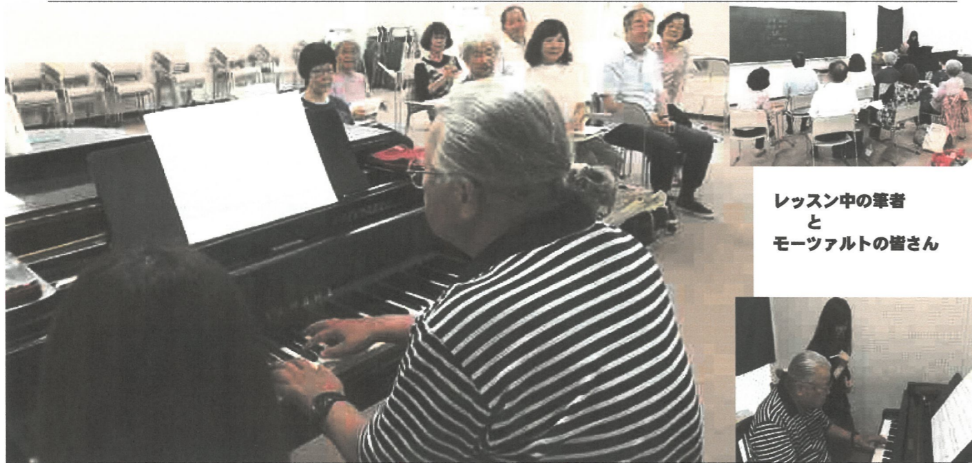
レッスン中の筆者とモーツァルトの皆さん