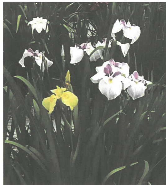
池田の池・花菖蒲

今年度の学園年間行事計画についても、例年に負けず劣らず、盛りだくさんの行事が計画されていますので学園生一人ひとりの生きがいの実現に向けて、みなさまと共に、元気に羽ばたいていきましょう。