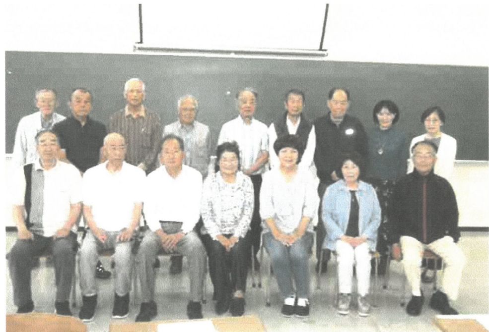
よろしくお願いいたします