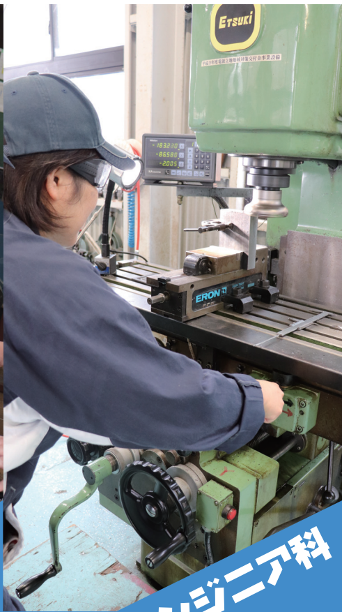
設備エンジニア科