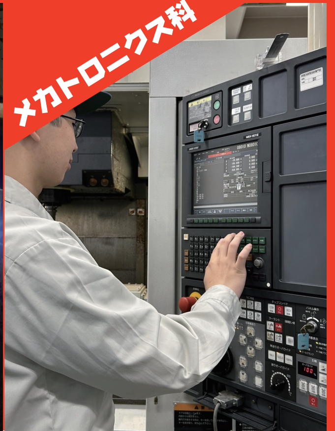
メカトロニクス科