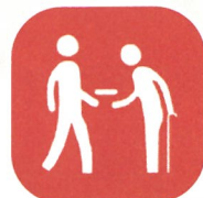
高齢者への配食サービス