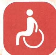
福祉施設・団体に車いす