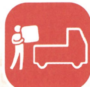
障がい者が働く作業所に支援