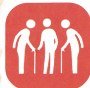
高齢者向けサロン