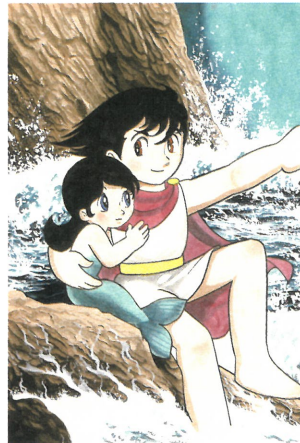
《海のトリトン》『サンデー・コミックス 海のトリトン』第2巻 表紙絵 1973(昭和48)年1月25日発行 秋田書店

「マンガの神様」と称されてきた手塚治虫は、17歳のデビューから60歳でこの世を去るまで第一線で活躍し、数多くの個性的なキャラクターを生み出してきました。子どもから大人までを魅了する幅広いジャンルの作品は、没後35年を経た今も、日本はもとより世界中の人々から高く評価されています。そこには作家が生涯問い続けた人間や生命の根源に関わる深いテーマやメッセージが込められ、多様な事態に直面する現代においても普遍的な輝きを放っています。