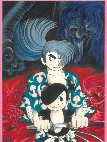
《どろろ》『冒険王』扉絵 1969(昭和44)年8月号 秋田書店