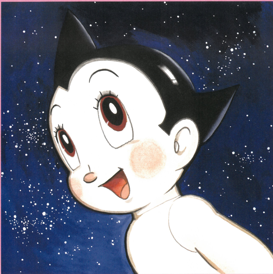
《鉄腕アトム》『手塚治虫漫画全集 鉄腕アトム』第1巻表紙絵 1979(昭和54)年10月20日発行 講談社