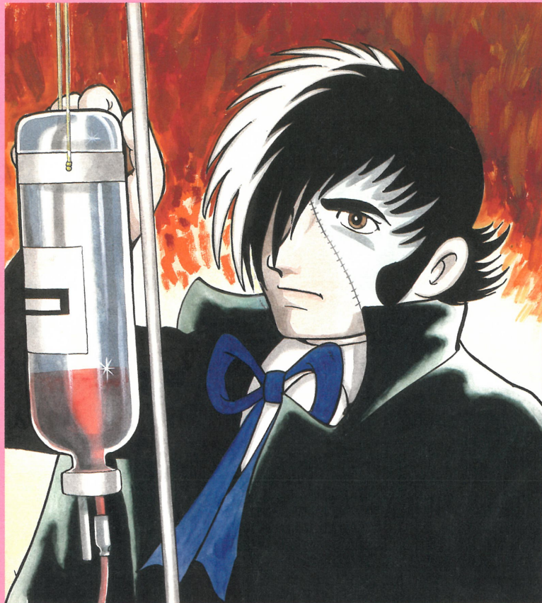
《ブラック・ジャック》『週刊少年チャンピオン ブラック・ジャック特集』増刊号 表紙絵 1976(昭和51)年3月10日発行 秋田書店