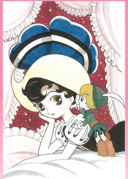
《リボンの騎士》『なかよし』扉絵 1964(昭和39)年9月号 講談社