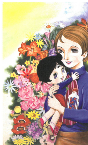
《ふしぎなメルモ》『よいこ』扉絵 1971(昭和46)年5月号 小学館

本展は「ジャングル大帝」「鉄腕アトム」「リボンの騎士」「火の鳥」「ブラック・ジャック」などの代表作を生み出した足跡を紹介するとともに、ストーリーマンガの確立、アニメーションへの挑戦など、多様な視点でその業績を振り返るものです。生涯に手がけた約15万枚におよぶ原稿から厳選した約300枚と、映像・資料・愛用の品々などもあわせて紹介し、作家が未来へ託したメッセージを読み解きます。魅力的なキャラクターによって繰り広げられる「手塚ワールド」を、ぜひお楽しみください。