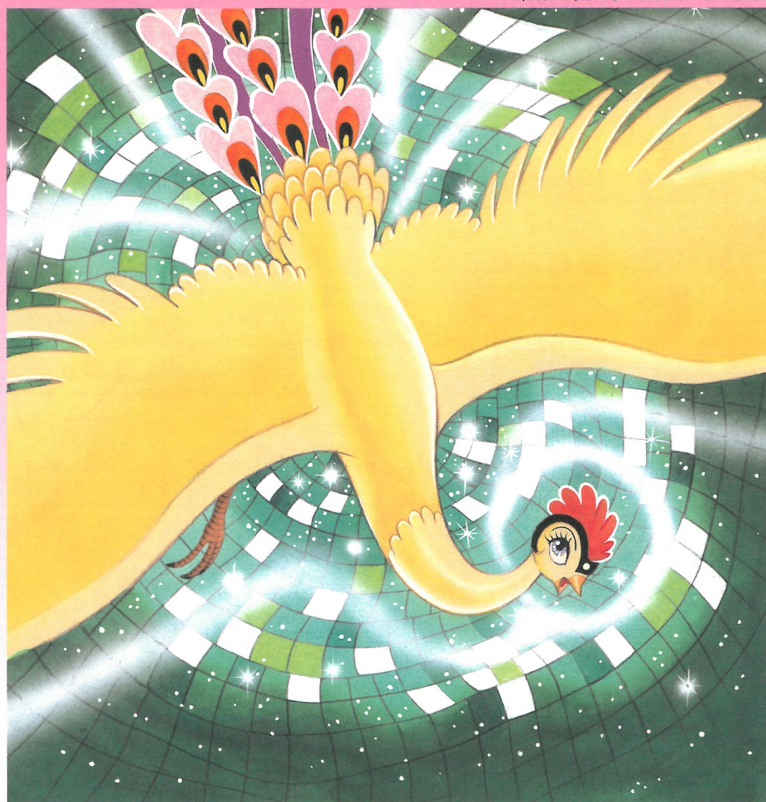
《火の鳥》『月刊マンガ少年 火の鳥 ヤマト・宇宙編』表紙絵 1976(昭和51)年10月1日発行 朝日ソノラマ