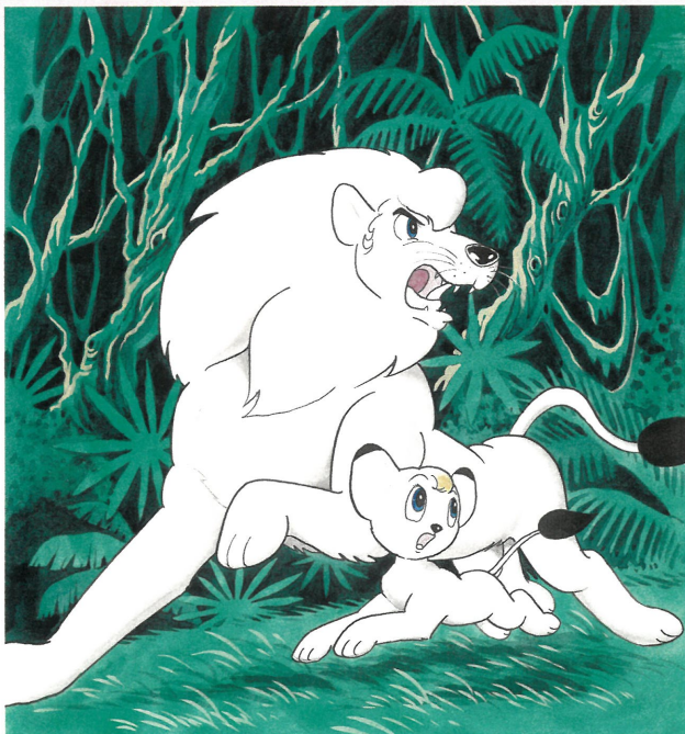
《ジャングル大帝》『サンデー・コミックス』第1巻表紙絵 1966(昭和41)年1月1日発行 小学館