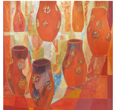
「やきものと色」より 廣川岳邦《窠変華1》1997年