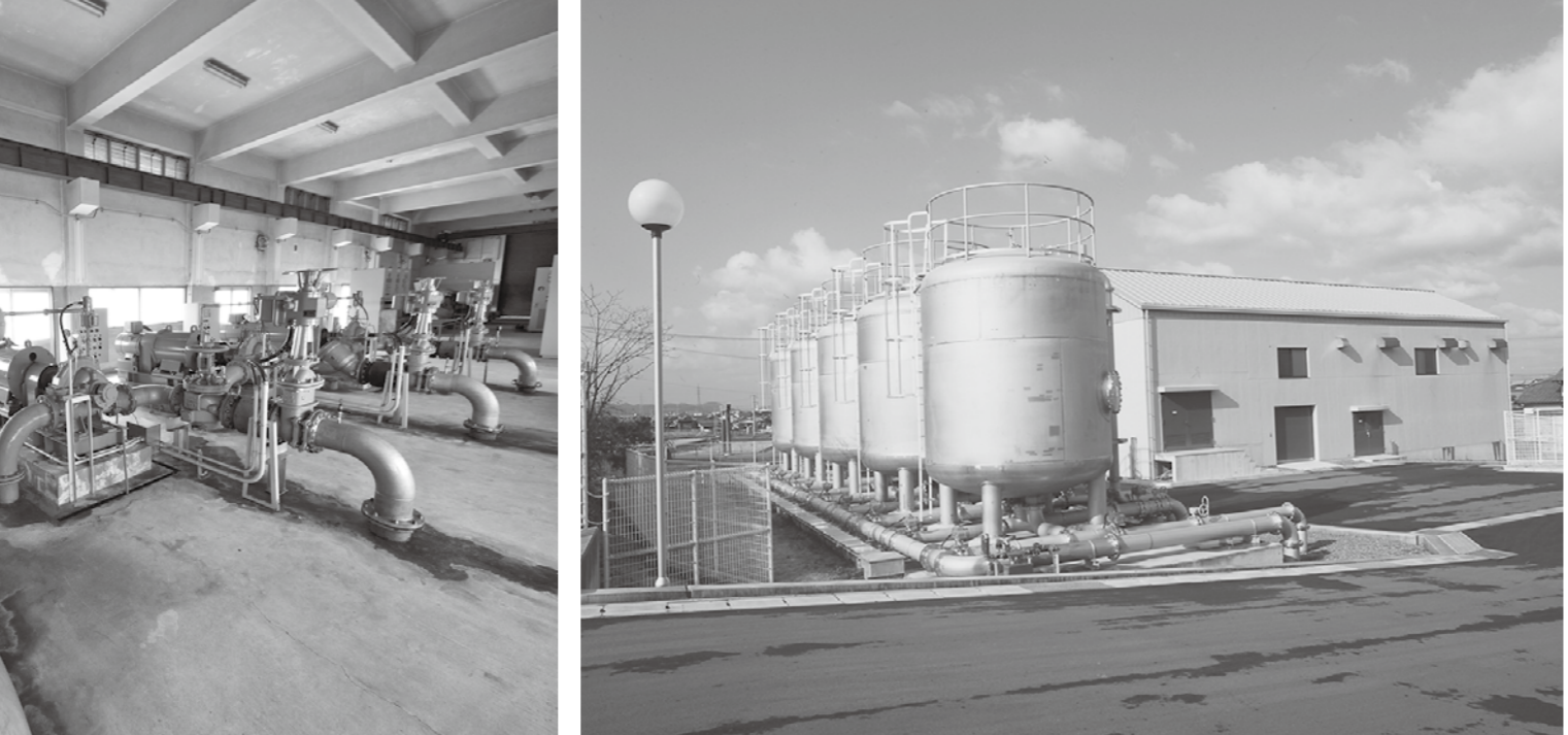
清注送水場の浄水施設(除鉄・除マンガン施設)

経営戦略の再見直し 1. 経営戦略の再見直し 2. 経営戦略の再見直し 3. 経営戦略の再見直し