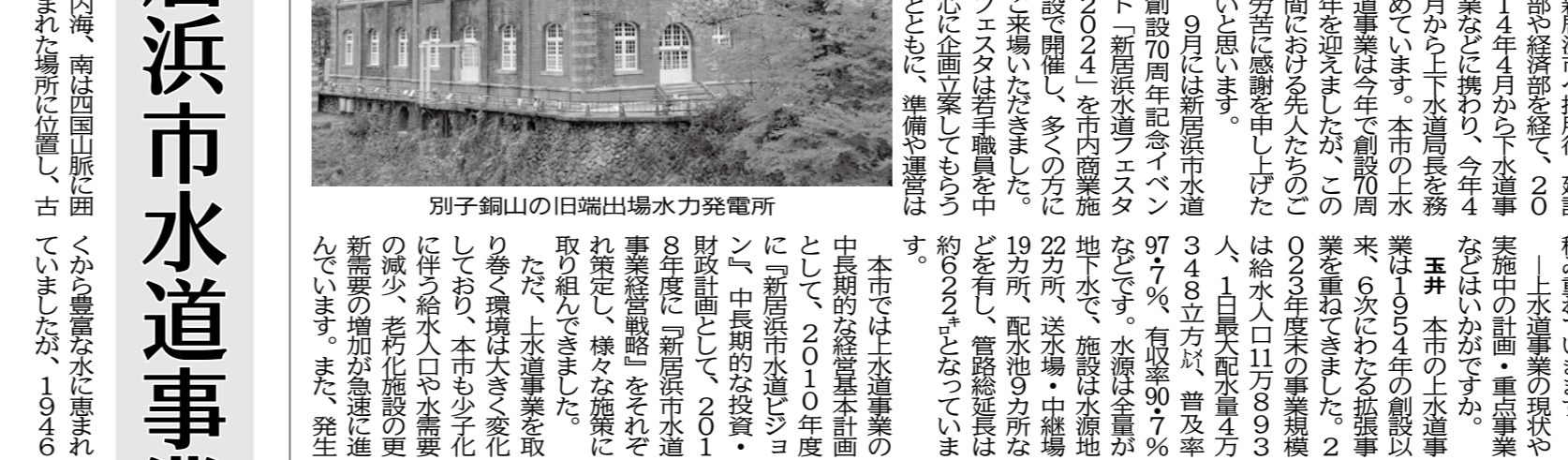
別子銅山の旧備工場水力発電所

新居浜市の上水道 1. はじめに 2. 水道創設70周年の意義 3. 事業の概要