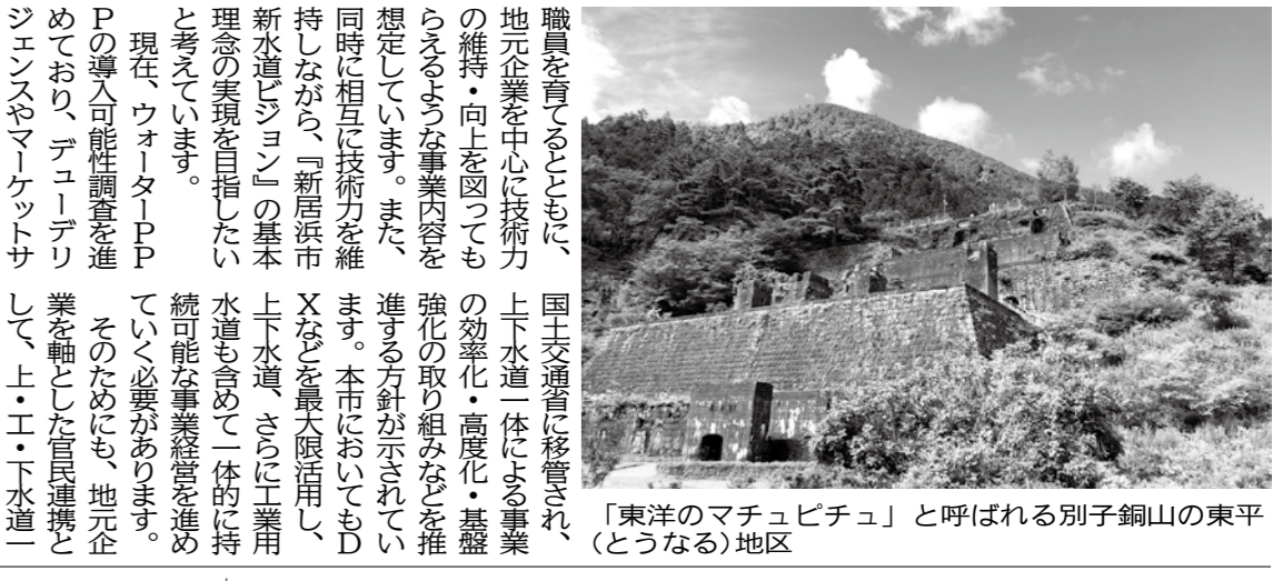
「東洋のマチビチユ」と呼ばれる別子銅山の東平(とうなる)地区

経営戦略の再見直し 1. 経営戦略の再見直し 2. 経営戦略の再見直し 3. 経営戦略の再見直し