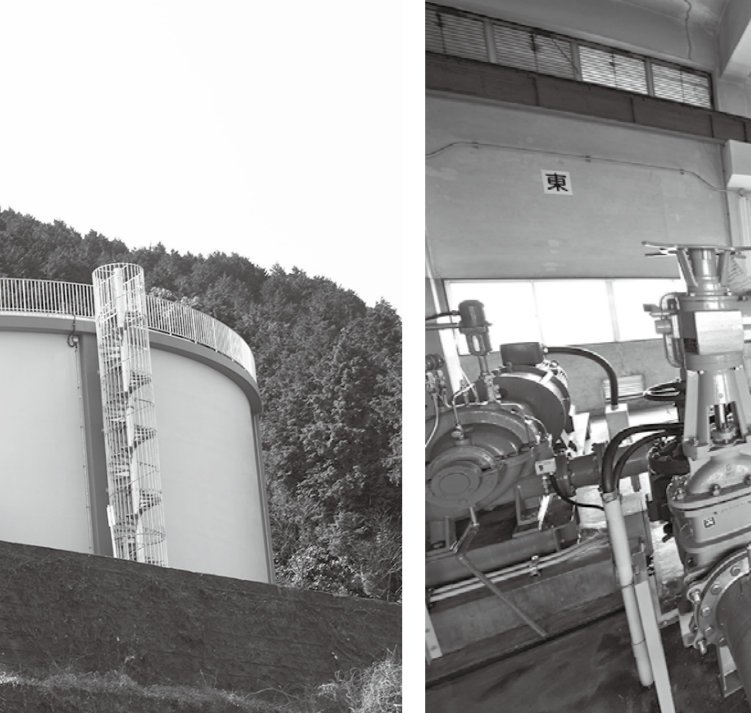
滴の高送水場の送水ポンプ

水源変化踏まえ創設し70年 次世代においしい水を実現へ 水源変化踏まえ創設し70年 次世代においしい水を実現へ