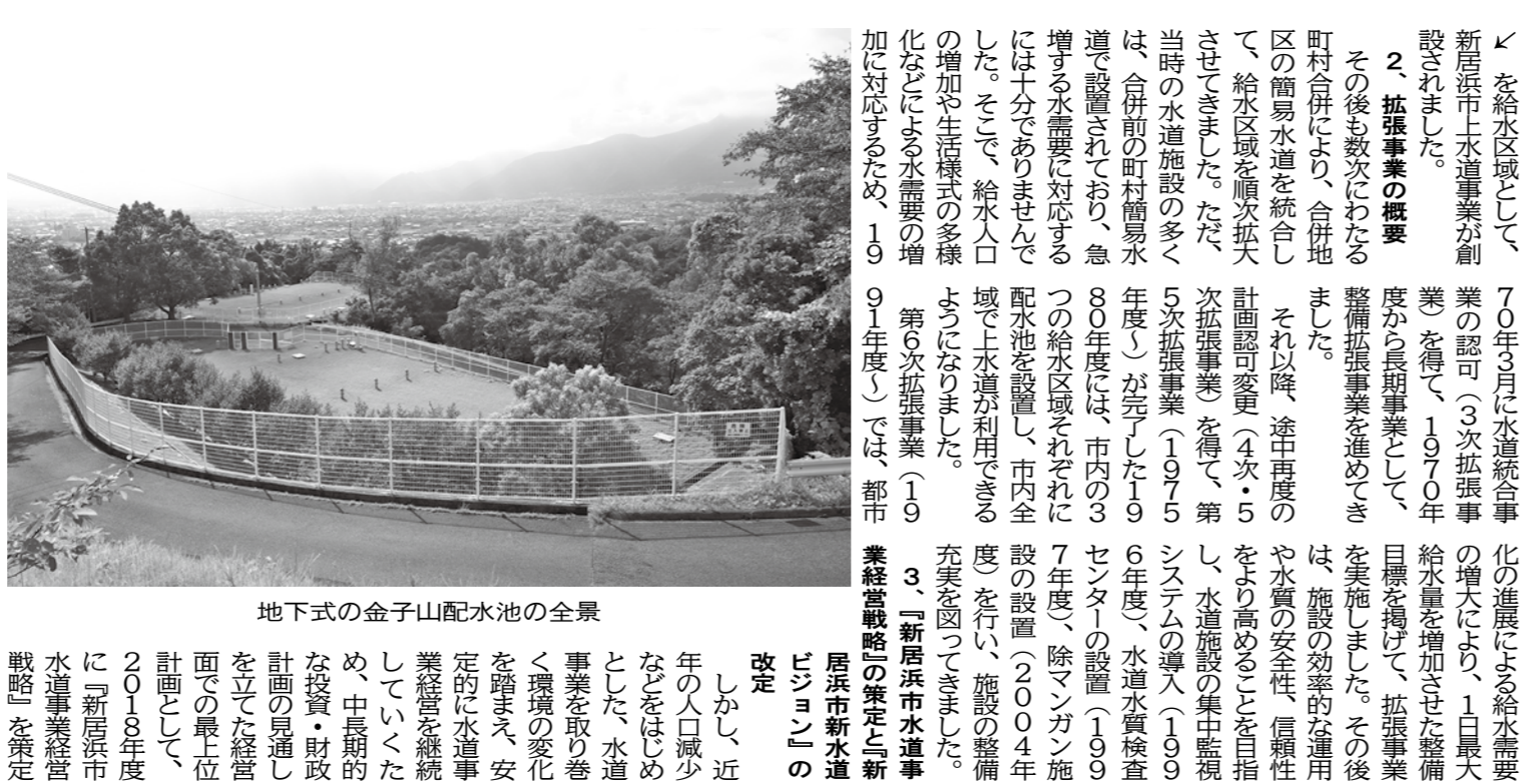
地下式の金子山配水池の全景

創設70周年を迎え、70年ぶりに経営戦略の再見直しを進めている。 創設70周年を迎え、70年ぶりに経営戦略の再見直しを進めている。