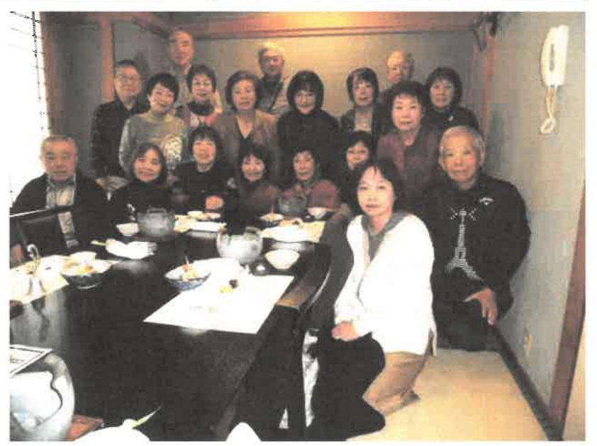
桃山Cのメンバー集合!! 親睦も大切