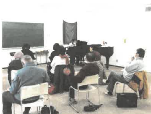
ピアノ室での練習の様子