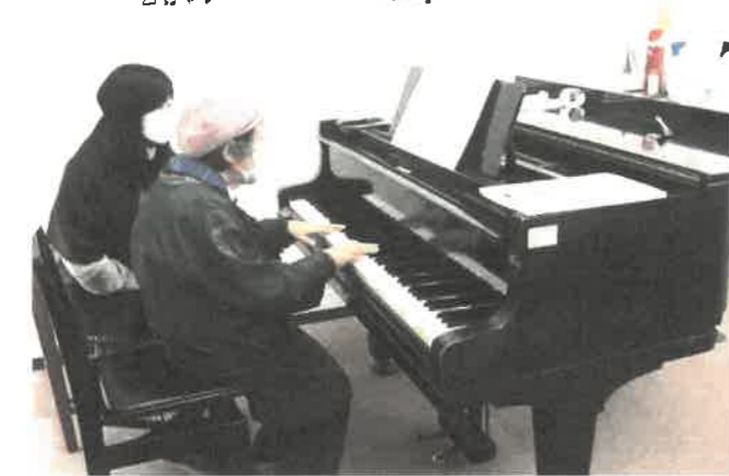
個別レッスン中 先生の前で弾くので緊張します。 でも、楽しい時間です!!

※状況により予定を変更する場合がございます。 最新の情報または詳細は各サークル代表者にお問い合わせください