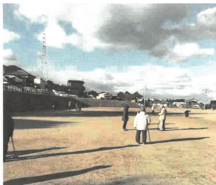
青空の下、練習に励む別子GGの皆さん