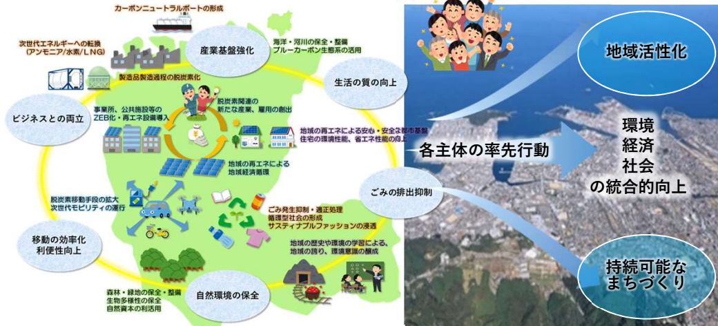
【2050年までに実現すべき姿（将来ビジョン）のイメージ】

本計画では、国の「地球温暖化対策計画」や「新居浜港・東予港（東港地区）港湾脱炭素化推進計画」との整合を図り、市民・事業者・行政が一丸となり、市内全域から排出される温室効果ガスを2030年度までに2013年度比で46%削減、2050年までにカーボンニュートラルを達成することを目指して取り組んでいくこととします。