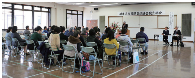
国際交流協会設立総会