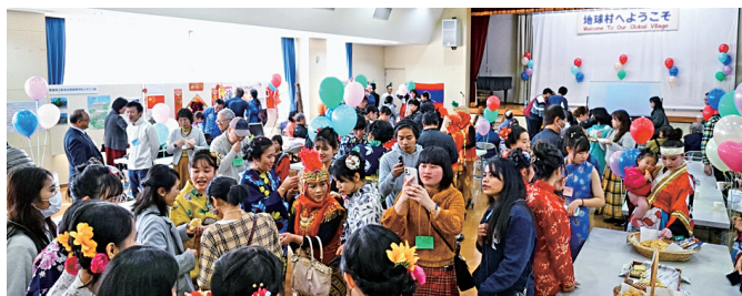
グローバルパーティー