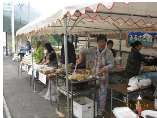
各自治会屋台テント

11月13日(日)別子校区産業文化祭を開催いたしました。 若干の曇り空でしたが、地域の皆様のご協力によりまして、盛大に実施する事が出来ました。今年度は、例年に比べ作品の出品数も増え、展示にもにぎわいを感じるほどでした。また、作品も一つ一つが素晴らしい出来栄で、見る目を楽しませていただきました。出品いただきました皆さんありがとうございました。 さらに、各自治会のテント村では各種屋台を出店いただき、早い時間に完売する等、大変盛況で、多くの来場者を迎える事が出来ました。 来年度の産業文化祭に向けて、今から準備を進めて頂き、来場される方を楽しませていただきますようお願いいたします。