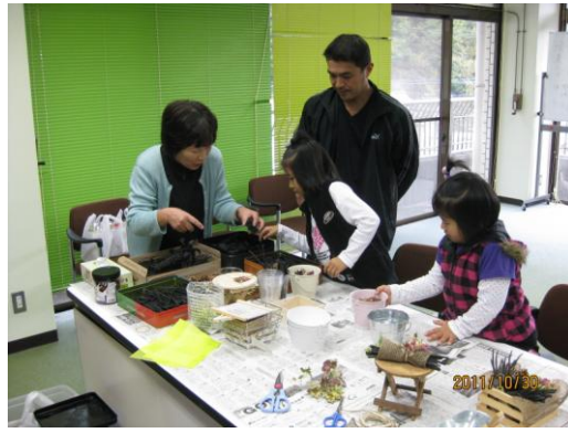
炭アート体験コーナー