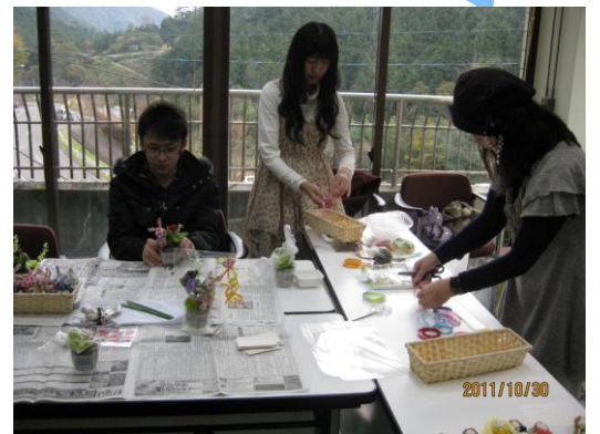
アクセサリ作り体験コーナー