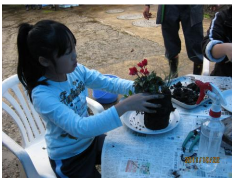
炭に花を植え込み中