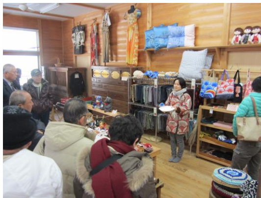
ゴミから再生(リユースの品)説明

始まりから現在まで、20年以上を経過し、多くの収入を得るお年寄りもいらっしゃるほどで、地域再生、過疎再生のきっかけとなる、名前のおり彩のある取組みでした。