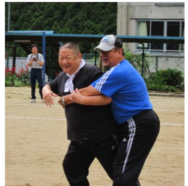
アツすぎる、2人の世界