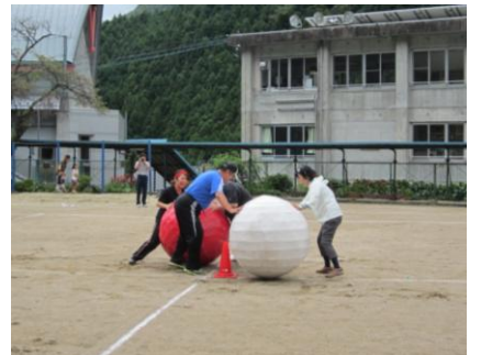
父ちゃん母ちゃん頑張れ