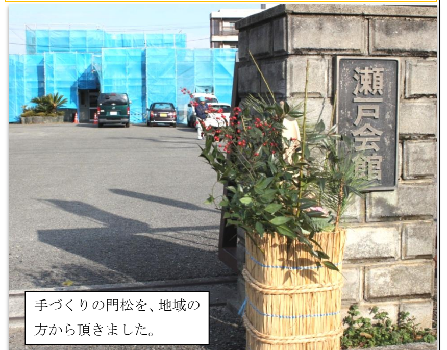
手づくりの門松を、地域の方から頂きました。