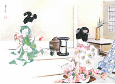
(角野 西村 栄子)

私は？：五感を研ぎ澄まし、集中できると思いきや、脳からの指令が伝わらない：汗：。金村先生そして、助手の荒井・入江両先生から一挙手一投足、理に叶ったお教えを頂き、ほんの少しでも所作が良ければすかさず褒めて下さる。てきぱきと熟す先輩方に助けられ、有難い言葉のエネルギーを感じながら、淡々と学び続けたいと願っております。感謝！