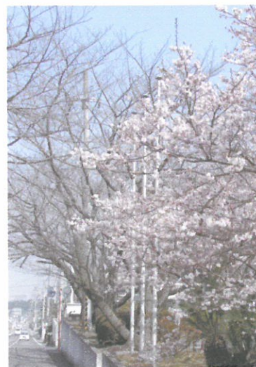
明正寺桜 (学園にて)

〈ハーモニカ〉 10:00～10:50 階段教室 〈コーラス〉 11:00～12:00 階段教室 〈ピアノ〉 12:10～13:10 階段教室 〈カラオケ〉 13:20～14:15 階段教室 〈社交ダンス〉 10:00～14:00 ホール