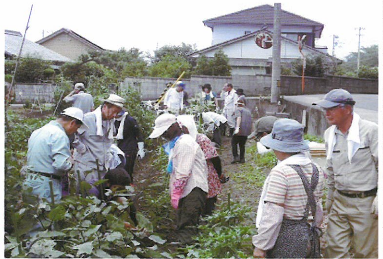
<講師の指導を受け農作業に取り組む>