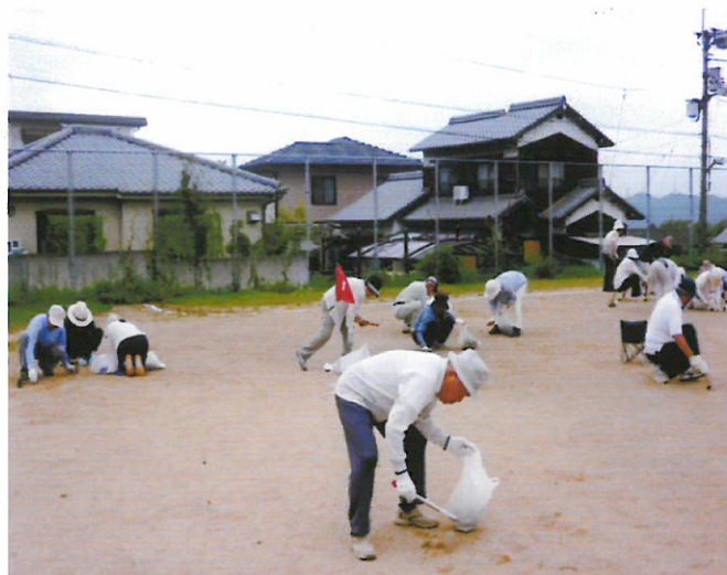
グラウンドゴルフ練習前の除草風景