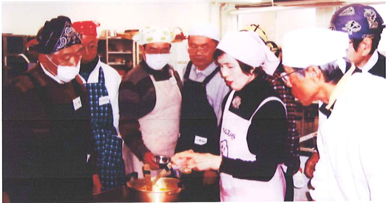
「男の料理教室」の一場面