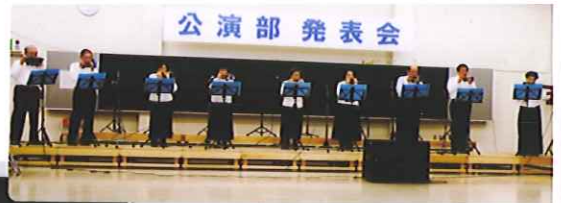
ブルースカイ ①高校三年生 ②下町の季節 ③志の季節