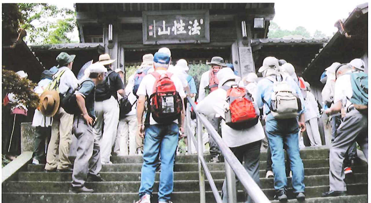
西条市「王至森寺」を訪れる