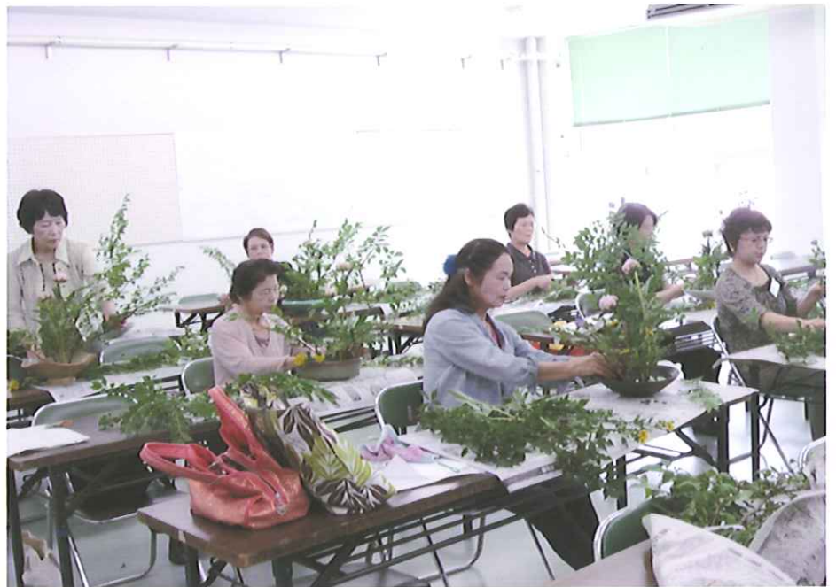
講座「生け花教室」の学習風景