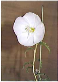
(金栄 高橋 一美)