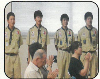
社会教育団体 ボーイスカウト