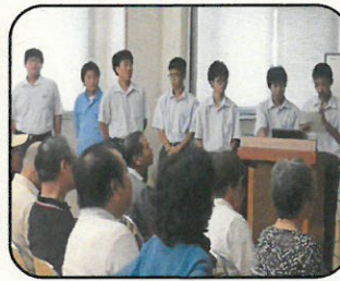
工業高校 電子機械部