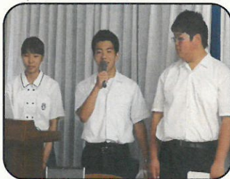
南高校 ユネスコ部