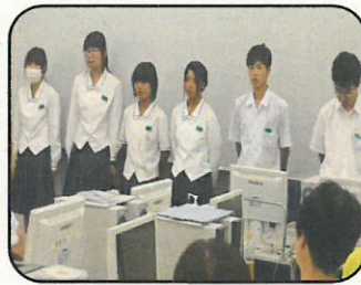
商業高校 情報ビジネス科