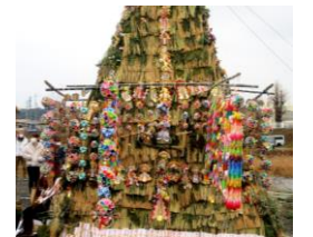
一年をかけて、お守りや鶴、飾り折り紙のご協力ありがとうございました。