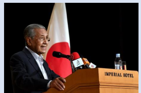
マハティール元首相 （第4代：81～03年；第7代：18～20年）

1982年に、マレーシア第4代首相（1981～2003年）に就いたマハティール政権の下で「日本から学ぶことによってマレーシアの社会経済の発展を目指そう」という目的で導入された政策です。開始以来、20,000人を超えるマレーシア人が留学・研修で日本へ派遣されました。