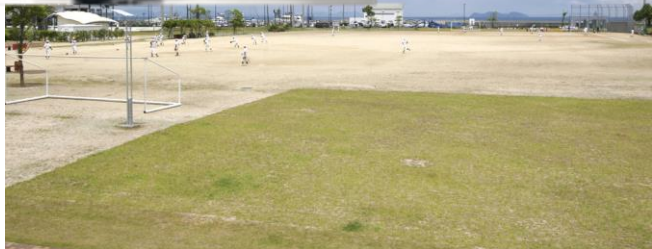
マリンパーク新居浜 多目的広場