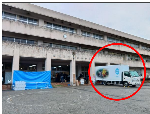
派遣したトイレカー（珠洲市立飯田小学校）

また、新居浜市においても南海トラフ地震など、いつこのような地震が起こってもおかしくない状態であることは皆様ご承知のことと思いますが、どうか自助の備えをしていただきますようお願いいたします。