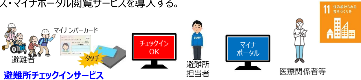
避難所チェックインサービス

■ 事業内容：公民館・交流センターなど避難所18か所に、避難所チェックインサービス・マイナポータル閲覧サービスを導入する。