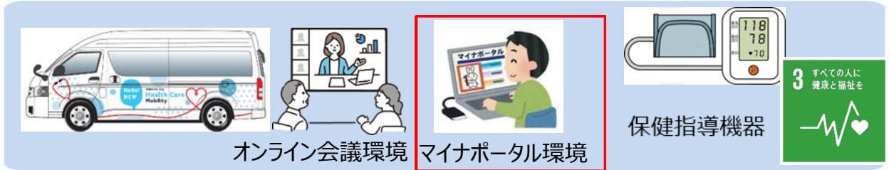
オンライン会議環境 マイナポータル環境

マルチタスク車両内にマイナポータルを参照できるよう、ICカードリーダーを具備したPC等を整備し、市民がマイナンバーカードを持参し、参照することでオンラインでの適切な健康相談、保健指導につなげる。