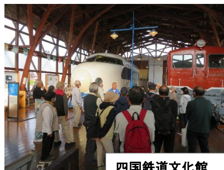
四国鉄道文化館 十河信二記念館 見学