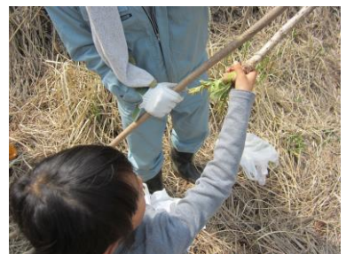
山菜取り：タラの芽採取

これからも様々なメニューを組み実施してまいりたいと思いますので、ご支援ご協力のほどお願いいたします。