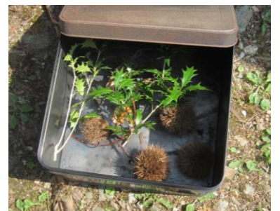
花炭作り体験状況