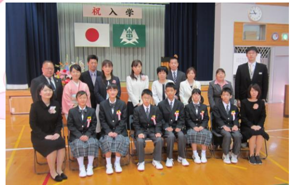
別子中学校新入生の皆さん

別子小学校も3年連続で新入児童を迎えることが出来ましたし、別子中学校では「グローバルジュニアハイスクール」の4期生を迎えることが出来、新入生誓いの言葉では、それぞれに、将来を見据えた行動力のある発言で、勉強にスポーツに全力で頑張ってくれるものと思います。