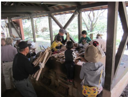
炭焼体験状況：竹炭作り

4月20日・21日の2日間「別子山の自然を守る・自然を食す・自然を満喫する・大自然を体験してください」のコンセプトに、別子山地域の未来を考える会が主催し「別子山ファンクラブ」会員に募集をし行われました。