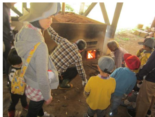
炭焼体験：火入れ状況