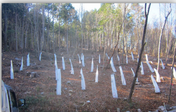
ナツツバキ、ドウダンツツジ、ヒメシャラ、ヤマクリ等

令和3年7月から始めました、愛媛県森林環境保全基金公募事業「別子山スローな森づくり事業」の経過ですが、手入れが行き届いていない別子山の広葉樹の森を対象にして、除間伐や植樹等の環境整備を行い、森の木々や小動物と心豊かに触れあう空間作りを行なっています。