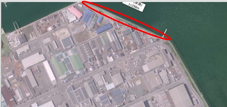
↑港湾・海岸補修事業 (阿島)