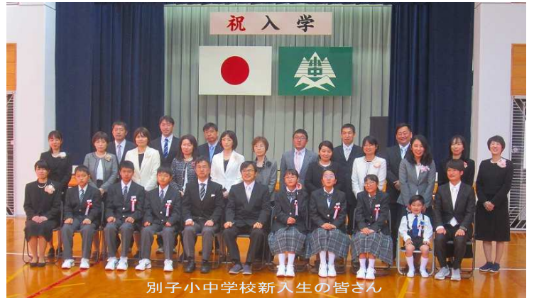
別子小中学校新入生の皆さん