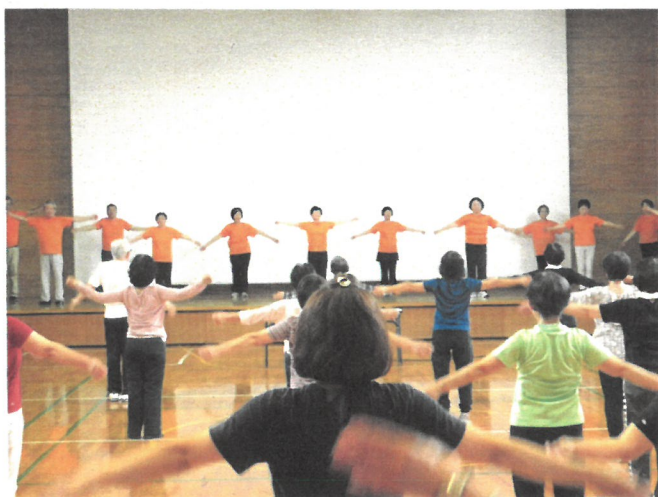
ラジオ体操ひろめ隊