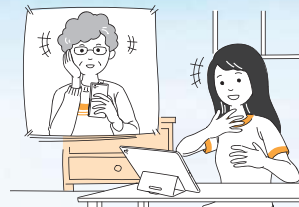
●家族や友人との会話