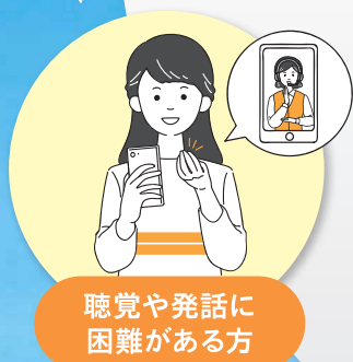
聴覚や発話に 困難がある方