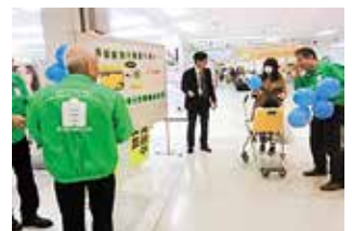
昨年のキャンペーン

毎年3月、加入促進キャンペーンを実施しています。今年は3月8日(日)11:00～14:00、イオン新居浜サウスコートで行います。自治会の入り方が分からない人、活動を知りたい人への相談窓口や、活動の発表展示、地域の絆づくり運動表彰式などがあります。アンケートにご協力いただいた人には粗品進呈！