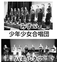
みすゞ 少年少女合唱団