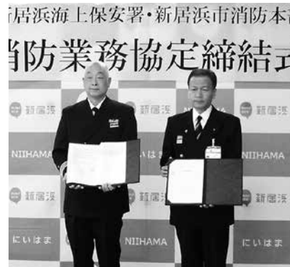
協定締結式の様子

海上保安署と「消防業務協定」を締結！ 総務警防課 ☎ 11340 FAX 3465 1189