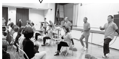
健康都市づくり推進員

第2次元気プラン新居浜21(後期計画)、第2次新居浜市食育推進計画を市HPで公開中! 概要版を各公民館や各支所などで配布しています。ぜひご覧ください!