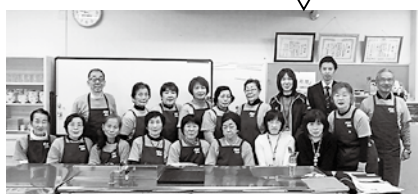
食生活改善推進協議会