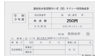
タクシー利用助成券見本