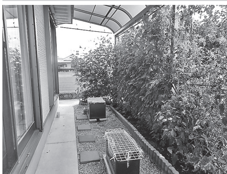
ニックネーム「ここ」さん（垣生）