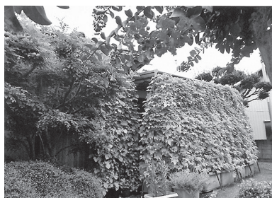
ニックネーム「くみちゃん」さん（久保田町）

新居浜市地球高温暖化対策地域協議会による審査の結果、最優秀作品（1人）、優秀作品（2人）が決まりました。フォトコンテストに応募いただいた皆さん、ありがとうございました。