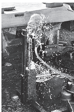
凍結による破損漏水