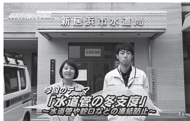
水道管の冬支度 ～水道管や蛇口などの凍結防止～

凍結の予防方法や凍結してしまった場合の対処法などを分かりやすく紹介した動画を、YouTubeで公開しています。