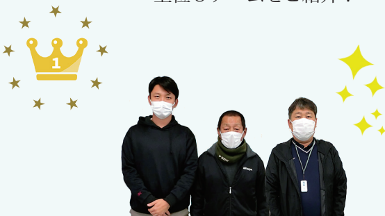
（公財）新居浜市文化体育振興事業団