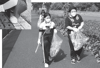
「泉川校区花いっぱい運動」や「大好き泉川の日」の活動の様子