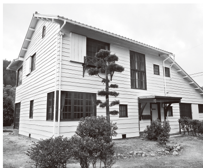
住友山田社宅(星越町)