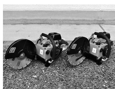
エンジンカッター