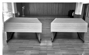
スタックテーブル