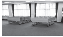
ミーティングテーブル